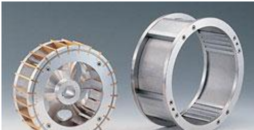
輪機轉刀、磨板網圈